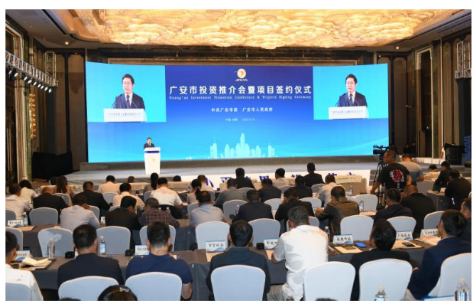
广安市委副书记、市长曾卿在推介会上致辞

从产业分类来看,一产业7个,协议总资金7.84亿元;二产业34个,协议总资金145.27亿元;三产业6个,协议总资金76.2亿元。无论是签约项目个数,还是投资金额,二产业都占了一大半,这与广安正加快构建“341”现代工业产业体系紧密相关。